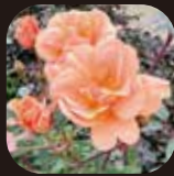
チャーリーブラウン