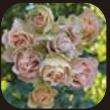
アンティークレース